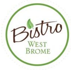
TABLE D'HÔTE DU MIDI: SOUPE OU SALADE + PLAT DU CHEF POUR 20$

LUNCH TABLE D'HÔTE: SOUP OR SALAD + CHEF'S SPECIAL FOR 20$